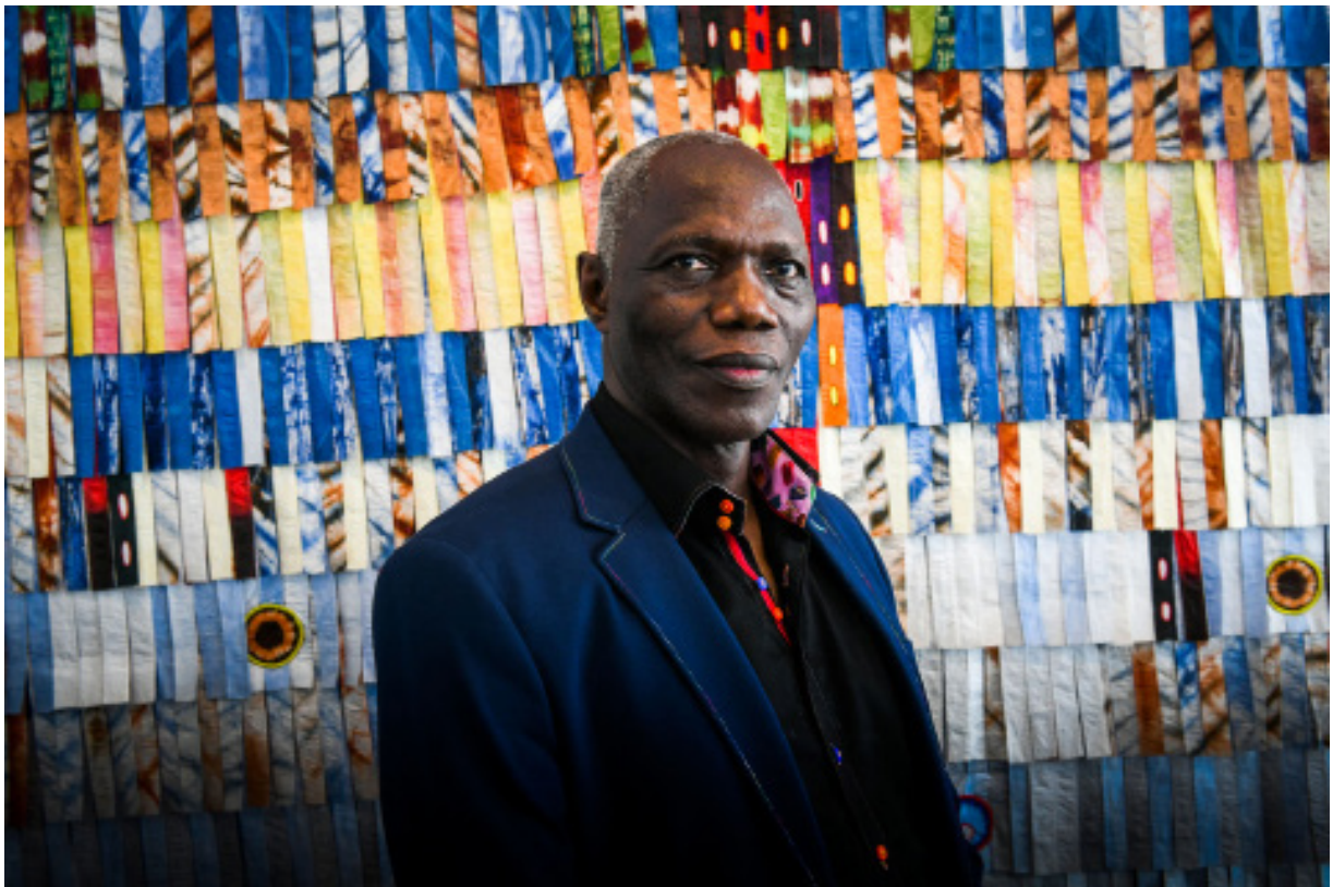
Abdoulaye Konaté en résidence artistique à Casablanca pour « Prête-moi ton rêve », août 2018.

La Fondation pour le Développement de la Culture Contemporaine Africaine (FDCCA) organise à partir du 18 juin 2019 « Prête-moi ton rêve », une grande exposition itinérante dans 6 pays d'Afrique, réunissant une trentaine d'artistes africains de renommée internationale, de 15 nationalités différentes.